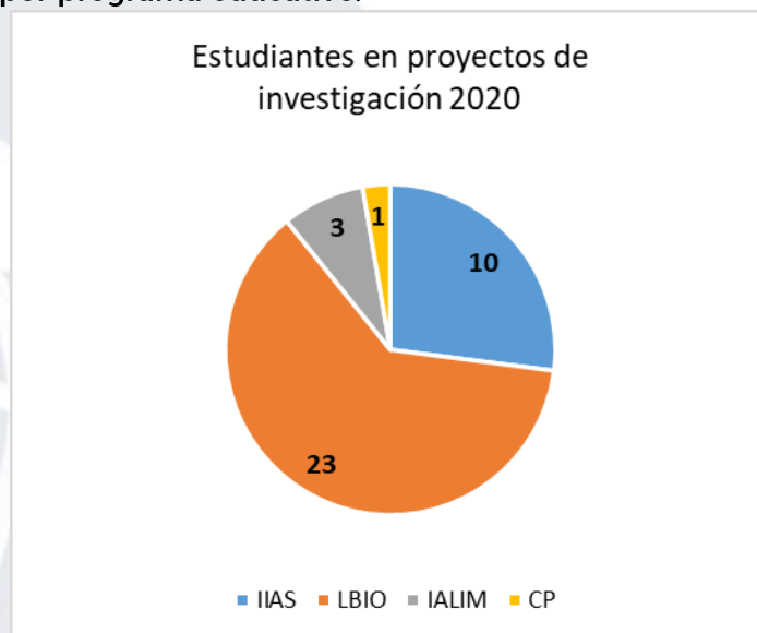
Gráfica 01, Distribución por programa educativo.