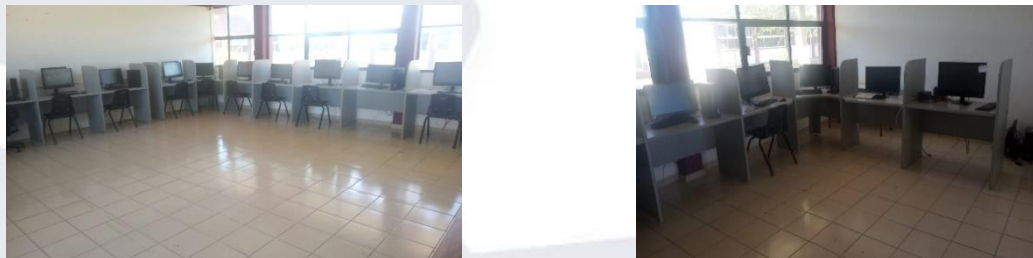
Figura 8. Equipos de cómputo nuevos en sala 4.

Se migró la página institucional del dominio anterior itvy.edu.mx al dominio vyaqui.tecnm.mx, la migración incluyó la adecuación de la plantilla institucional del TecNM y la migración del contenido más relevante del sitio anterior.