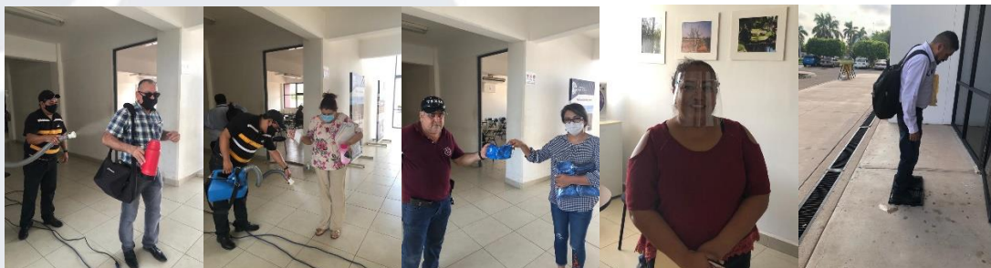
Figura 10. Actuación en pandemia