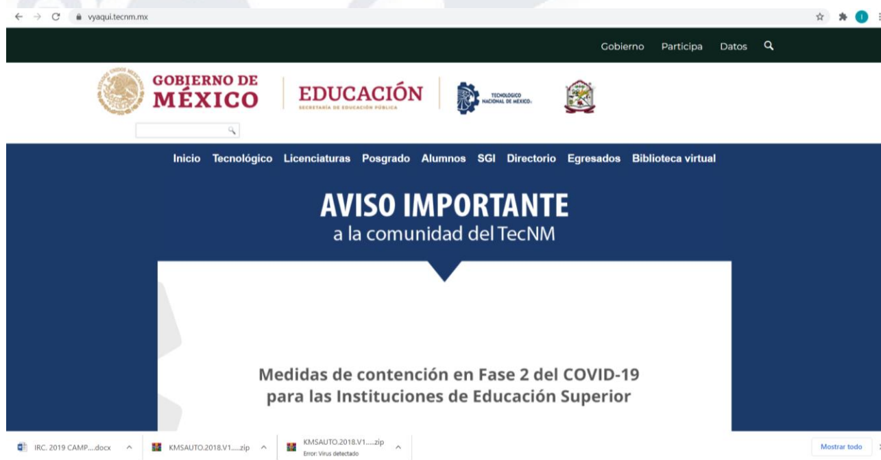
Figura 9. Cambio de dominio.

Se adquirieron refacciones para reconstruir computadoras que se tenían almacenadas en el taller de Centro de cómputo, con estas refacciones será posible contar con un máximo de 12 computadoras reacondicionadas para el próximo ciclo escolar.