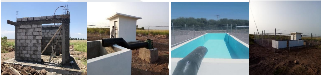
Figura 12. Trabajos realizados en el pozo institucional