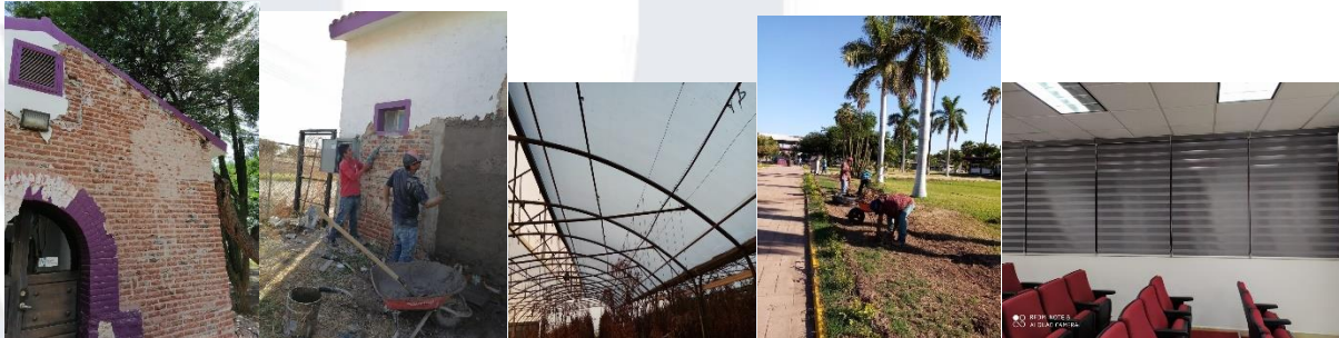
Figura 11. Fortalecimiento a la infraestructura