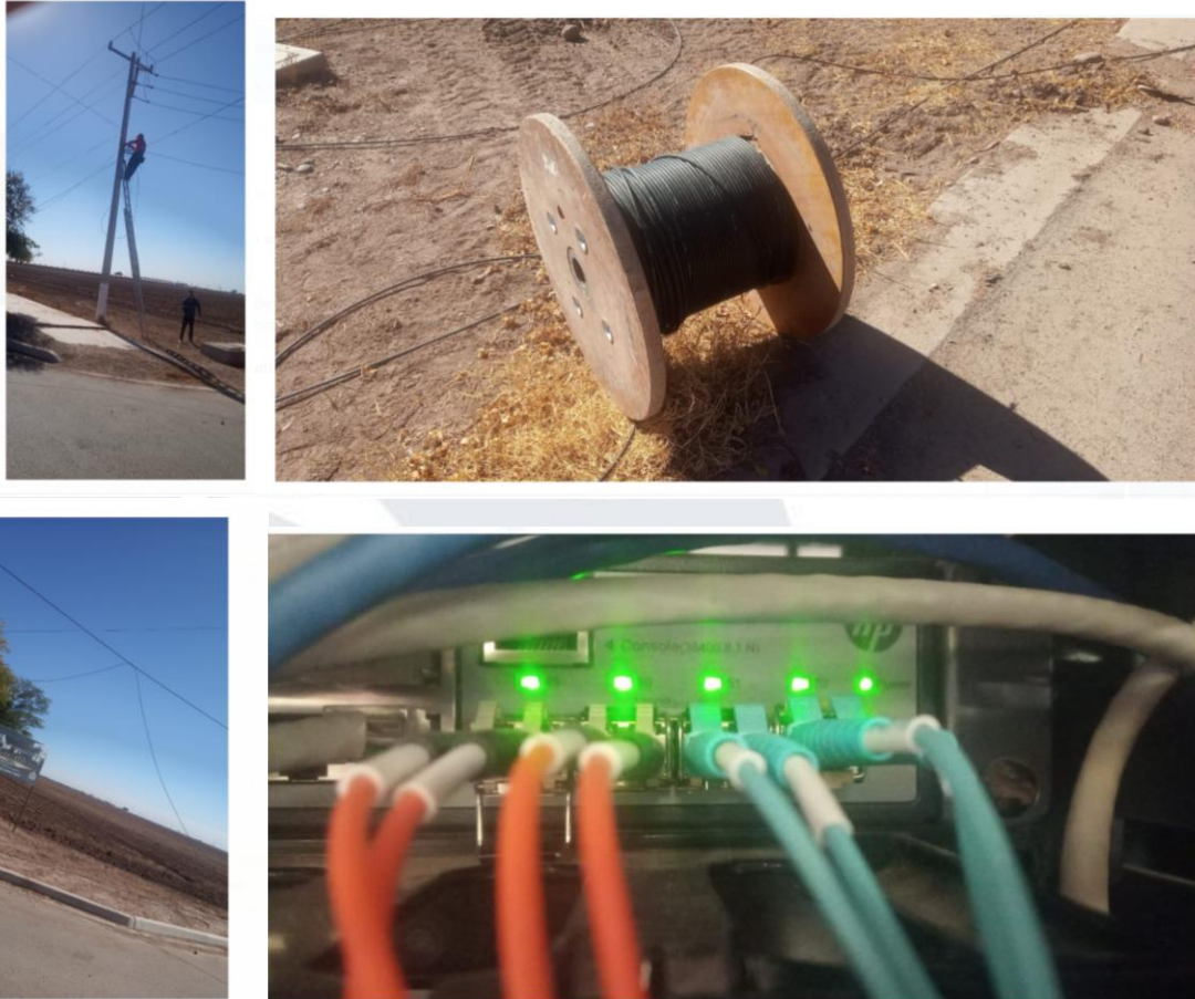
Figura 6. Mejoras en la conectividad de internet.

Durante la pandemia se habilito una plataforma de soporte técnico para atender remotamente a todos los usuarios que utilizan alguno de los servicios a los que Centro de Cómputo da acceso. La plataforma esta hospedada en itvy.edu.mx/helpdesk .